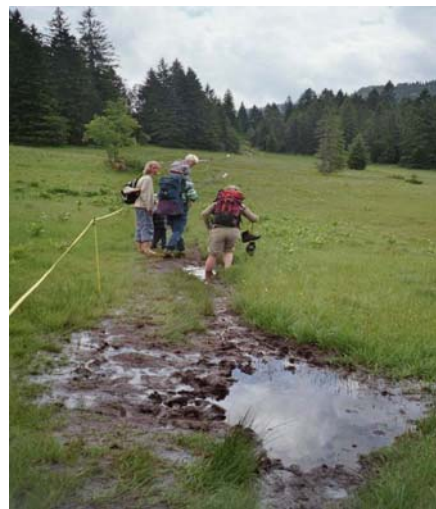
Rundwanderung Barfussweg Wolzenalp