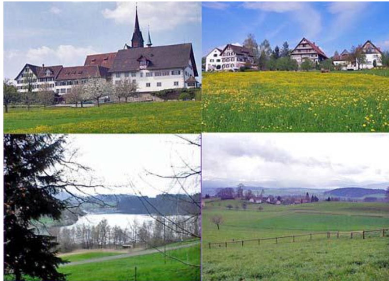
Bilder von der Wanderung