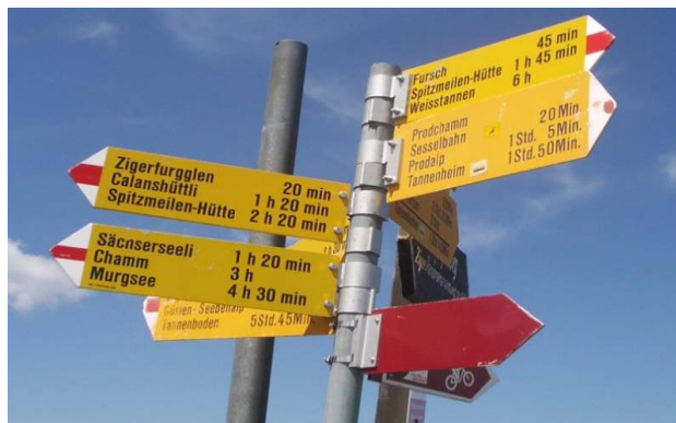
Wegweiser auf dem Maschgenkamm 2019 m

Treffpunkt: 09.00 Uhr Maschgenkammbahn. Wenn genügend Autos dabei sind, lassen wir ein Auto im Tannenheim stehen, sonst müssen wir entweder am Beginn oder am Ende der Tour das Postauto benutzen.