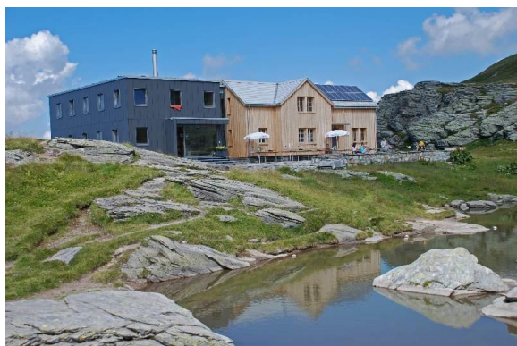
Spitzmeilenhütte 2087 m

Spitzmeilenhütte 2087m – Alp Fursch 1792m – Panüöl 1803m – Prodalp 1576m (2 h) Aufstieg: 60m, Abstieg: 511m