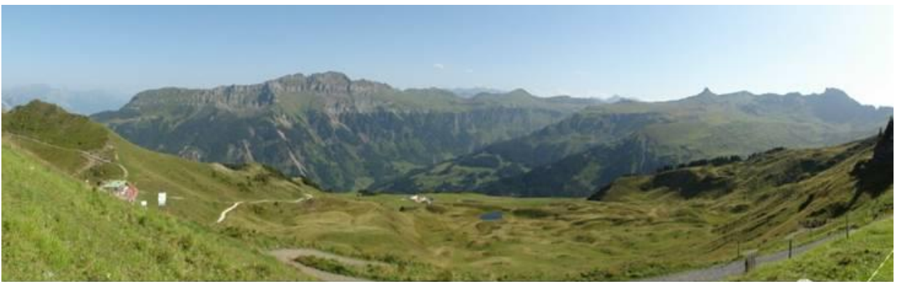
Panorama auf dem Weg zur Spitzmeilenhütte