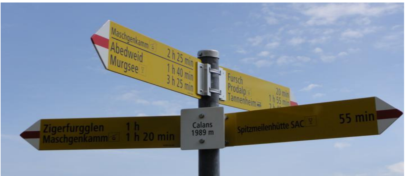
Abzweiger auf dem Rückweg Richtung Prosdorf