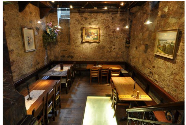
Mittagessen in der Buschenschenke in Rudolfingen