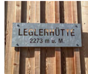
da git's feins Ässe und z'Trinke