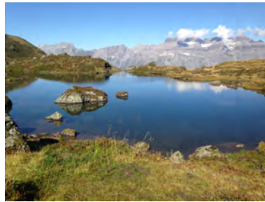
Ängiseen mit Glärnisch